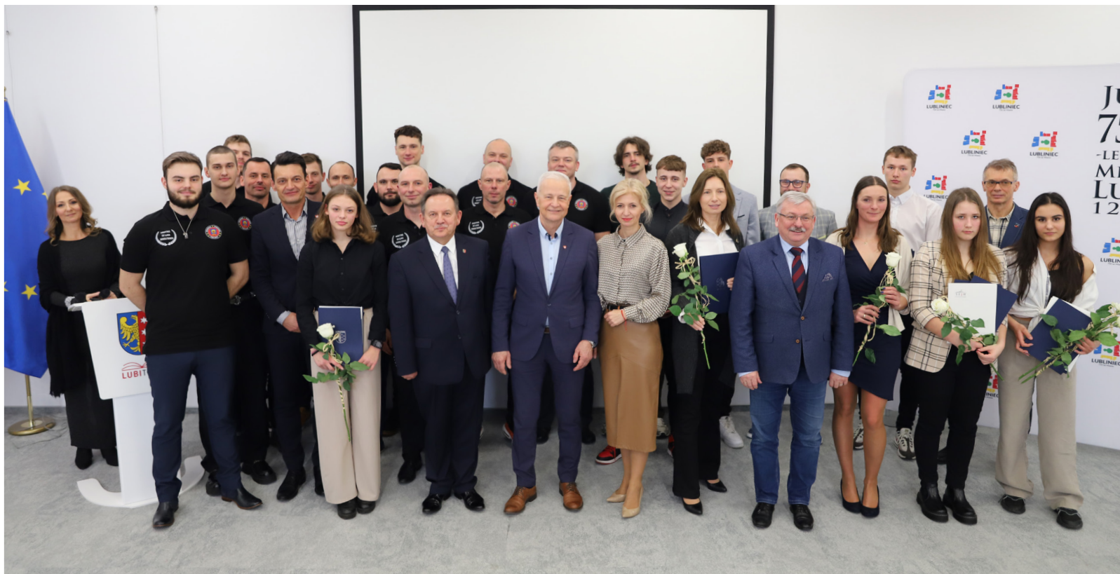
Laureaci nagród sportowych i stypendiści

W dniu 28 lutego br. w Lubitece odbyło się uroczyste wręczenie Nagród Burmistrza Miasta Lublińca w dziedzinie sportu oraz stypendiów sportowych. Gościem specjalnym wydarzenia był Apoloniusz Tajner - szkoleniowiec reprezentacji Polski w skokach narciarskich w latach 1999–2004, obecnie poseł na Sejm RP.