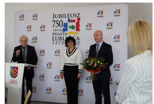
Podziękowanie Klubu Radnych „Forum Samorządu Lublinieckiego” dla zastępcy burmistrza